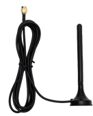
2米吸盘天线-4G (可选配机柜天线, 胶棒天线等)